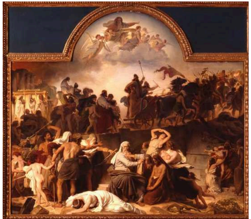
📷 Eduard Bendemann: Die Wegführung der Juden in die babylonische Gefangenschaft, 1865

This year, the Gaza war has brought us even closer to the grief, the affliction and the misfortune. But also closer to our ability to react to it. Because it is not enough just to consult our history and our tradition when interpreting the world. We must also apply them to our present and future and our actions. Only then will we remain a people that masters tradition and adaptation at the same time. Some claim that this is the main reason why we still exist. Who knows?