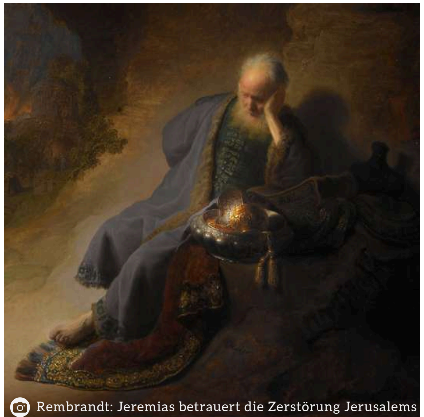
Rembrandt: Jeremias betrauert die Zerstörung Jerusalems

Der Überfall der Hamas am 7. Oktober ist für uns als Volk nicht von der Bedeutung einer Tempelzerstörung, aber seit sehr langer Zeit die größte Heimsuchung. Sie bringt uns erneut an unsere Grenzen, sowohl was den Schmerz und die Trauer angeht, aber auch bezüglich der Reaktion auf das Unheil. In Israel (und der Welt) spüren wir überall, dass zwischen Rache, Habgier einerseits bis Versöhnung, Friedenssuche und Kooperation andererseits alle Reaktionen gewünscht und auch durchgeführt werden. Aber vor allem wird darüber gestritten. Kaum einer Jüdin oder einem Juden kann der Gazakrieg, seine Entstehung und seine Führung egal sein. Wir müssen uns dazu verhalten - so wie uns auch der